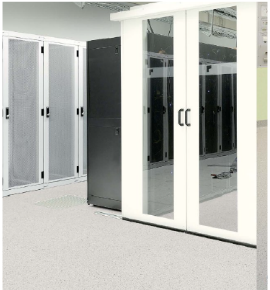
Rollo de 2.0 x 23.0 m 2 =46.00m 2